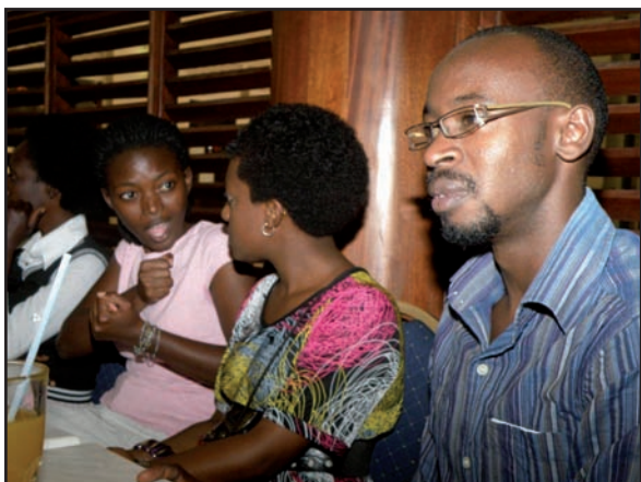
Träff med personer med dövblindhet

nerna då vi diskuterade lite vad som hade hänt sedan sist och hur långt de hade kommit i sina förberedelser. Alla tre hade utsett tre representanter vardera till en projektgrupp. Alla tre hade också påbörjat viss uppsökande verksamhet och berättade för oss om personer med dövblindhet som de känner till.