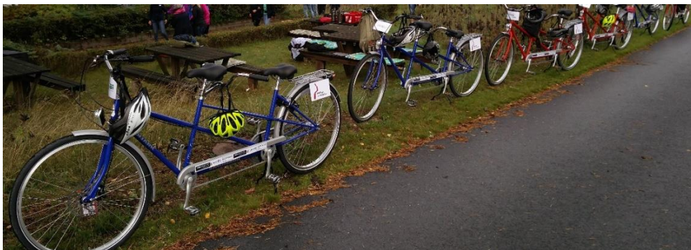
Bildbeskrivning: Fem tandemcyklar på rad.